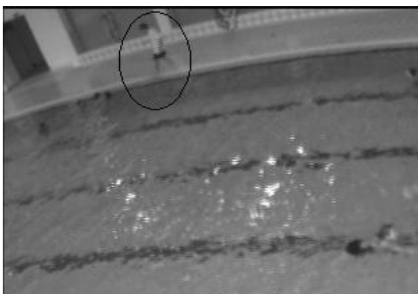
Image 4 : 16 :19 :02 le sauveteur extrait la victime du bassin et opère les premiers secours